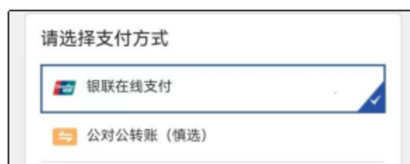
进入小程序缴费环节页面